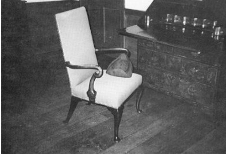
Cadeira de Wesley

John Wesley nunca pretendeu fundar uma igreja separada. Os suas casas eram lugar de pregação. As celebrações e os encontros Metodistas tinham lugar a diferentes horas dos serviços realizados pela Igreja de Inglaterra. O povo Metodista era encorajado a assistir nas igrejas da sua paróquia e a receber lá os Sacramentos do Baptismo e da Santa Ceia. Chamavam sociedades aos seus grupos locais - uma palavra que serviu para descrever os membros de uma igreja Metodista até 1974. As grandes Sociedades eram divididas em grupos ou classes com um líder, que se encontrava regularmente com eles e lhes dava assistência pastoral. Em 1744 realizou-se a primeira Conferência Metodista na "Fundição", a qual se tem realizado anualmente desde então. Em 1746 as Sociedades foram agrupadas em Circuitos (também denominados Círculos). Só depois da morte de Wesley, os Circuitos foram agrupados geograficamente em Distritos, tendo cada um, um Presidente.