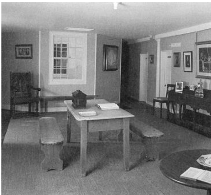
Sala Comum dos Pregadores Capela de John Wesley (New Room) em Bristol

Em volta do pátio havia estábulos para os cavalos dos pregadores. A estátua equestre de John Wesley (já mostrada) encontra-se agora no seu centro. Entrar neste pátio, vindo do moderno e movimentado centro comercial é como retroceder dois séculos e meio. Poucos visitantes Metodistas não se comoverão, ao ver a mais velha igreja Metodista do mundo.