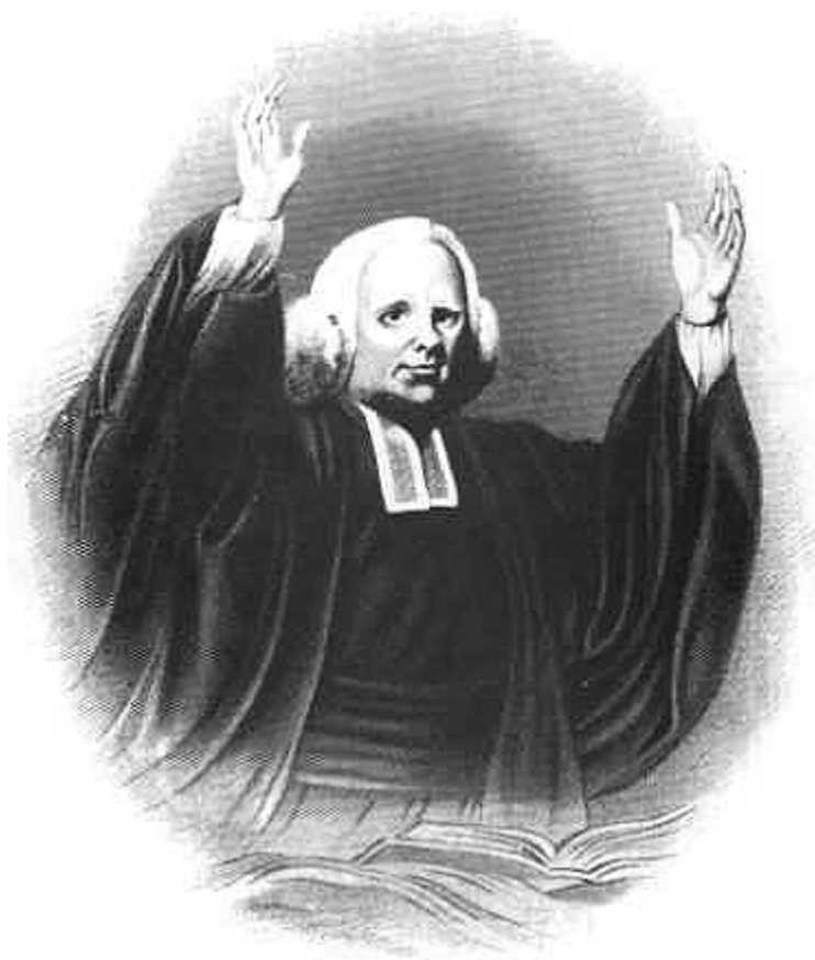
REVº GEORGE WHITEFIELD

Ainda que não possuindo o poder dramático de Whitefield, John Wesley era um pregador por poucos igualado quanto ao efeito sobre o povo - sincero, prático, corajoso. Daí em diante percorreria a Inglaterra, a Escócia e a Irlanda.