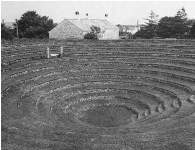
Arena de Gwennap tal como é hoje.